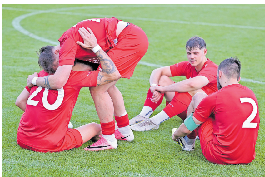
Aus und vorbei: Die Spieler von Chur 97 spenden einander Trost.